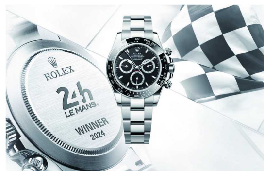
2024 年勒芒 24 小时耐力赛获胜车手将获得镌刻 TW 特殊字样的蚝式恒动宇宙计型迪通拿腕表

奖台，在冠军奖杯上永久铭刻其辉煌战绩。为了表彰车手对卓越的孜孜追求与坚定投入，劳力士还将授予他们赛车运动至高荣誉，一只镌刻特殊字样的蚝式恒动宇宙计型迪通拿（Oyster Perpetual Cosmograph Daytona）腕表。