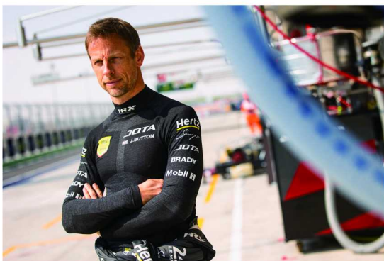
劳力士代言人简森·巴顿在 2024 年勒芒 24 小时耐力赛前夕