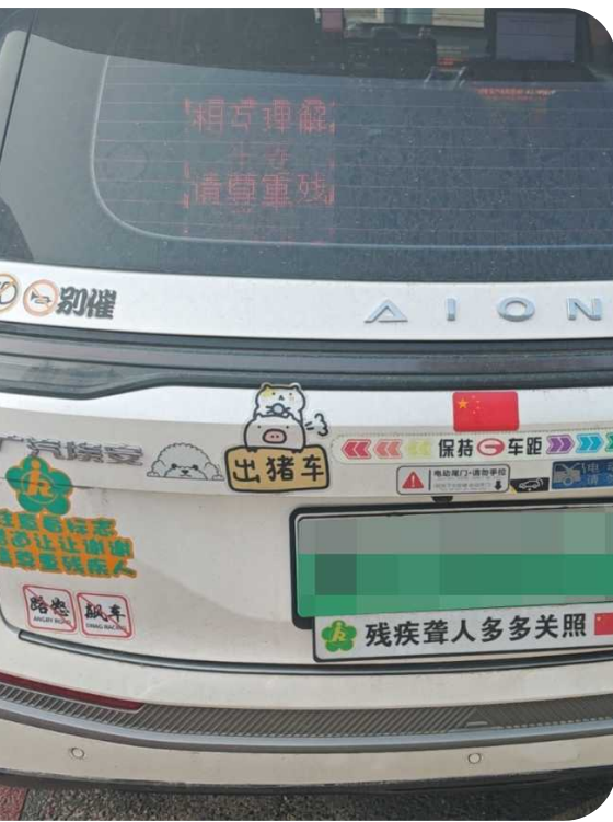
刘师傅车上的贴纸