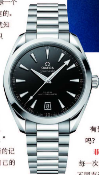
欧米茄海马系列 Aqua Terra 腕表黑盘款

马尔尚: 我经常喜欢看迈克尔创造世界纪录的比赛视频，我的梦想就是能够接近他的速度。我记得在我抵达终点时，已经预料到自己打破了纪录。我当时想，“就是它，我想我做到了。”我慢慢转身，看向欧米茄的记分板，我简直不敢相信自己的眼睛。