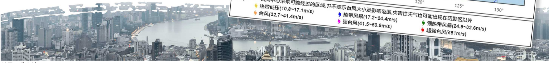
制图 / 潘文健