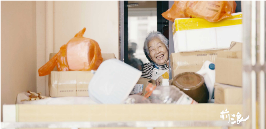
没有一个典型的老人

最终这一集的故事取名为《明天会更好》，也很难总结主题，很难写剧情梗概，“好像讲了一个老人学车的故事，又好像在说老头和老伴两个人生活理念的问题，又似乎是在说当下小老人要照顾老老人的社会议题。”