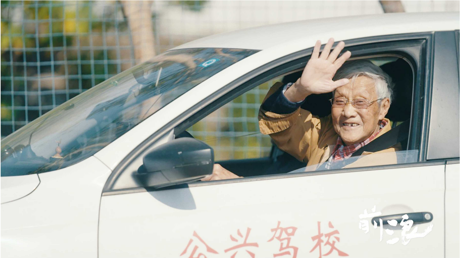
95岁老人开始学开车

对于拍什么有确定，对于拍成什么样的，范士广也很明确。“不要做关于解读养老政策的纪录片；也不要做悲情、沉溺于情绪的内容，空洞地赞美衰老是荒唐的，一味地说老年人惨也只是情绪，不是事实。”