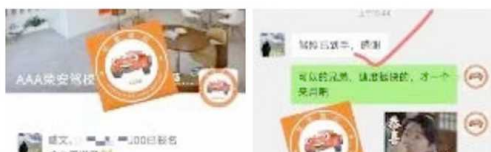
荣安驾校的宣传内容