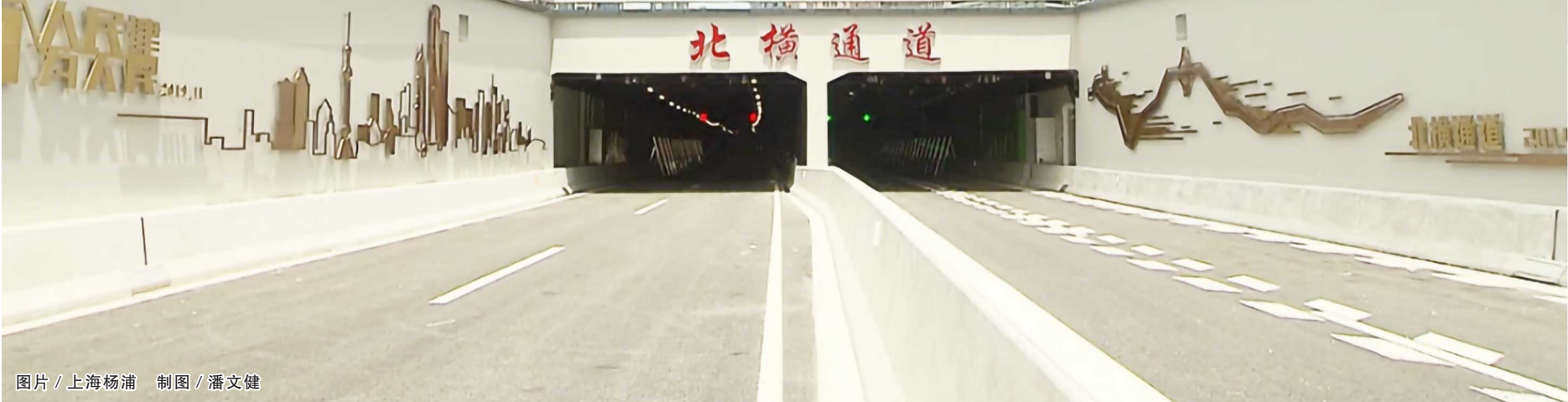
图片/上海杨浦 制图/潘文健

虹口段进出口连接匝道临近新建路隧道，交通情况更为复杂，交警部门提前研判，预先调整了交通组织方案。一是周家嘴路西向东车辆禁止右转进入新建路，需由高阳路绕行。二是车辆从北横通道通州路出口出来后，禁止在通州路、海伦路东向北右转，需由金田路绕行。三是公平路南向东车辆禁止右转进入北横通道，需由海门路、周家嘴路绕行。四是海伦路禁止北向西右转弯车辆直接进入北横通道，要经过海拉尔路、通州路绕行。