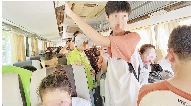
记者上车时看见部分游客都站着