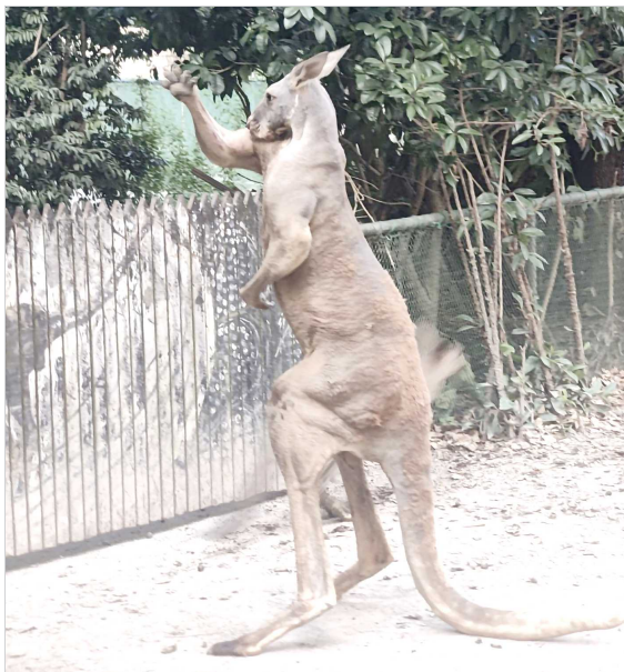
站立起身的袋鼠比篱笆高出近两个头