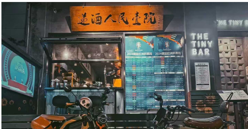
递酒人民壹院酒吧门口

“学术酒吧”如何吸引着一波又一波的年轻人？它是否能够成为带动夜经济发展的流量密码？当热度褪去，“学术酒吧”又该何去何从？近日，晨报记者走访上海多家酒吧，和从业者、消费者一起来聊聊他们眼中的“学术酒吧”。