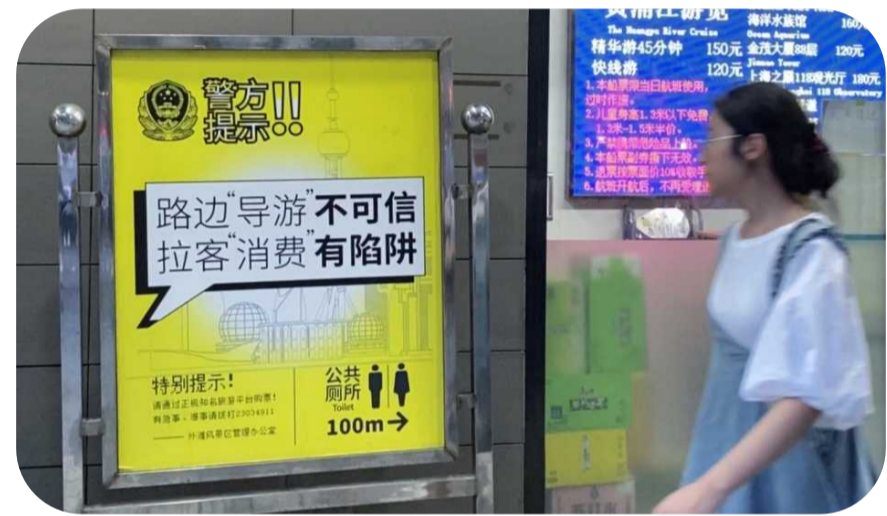
打击“黑导游”的宣传标语被摆到了轮渡口

同时,浦东文旅执法大队在陆家嘴综管办的牵头下,也对小陆家嘴地区主要景点进一步加强巡查,并联合约谈主要景点经营者。