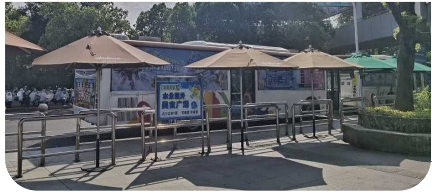
玛雅海滩水公园已在接驳车站点增加了4把移动遮阳伞