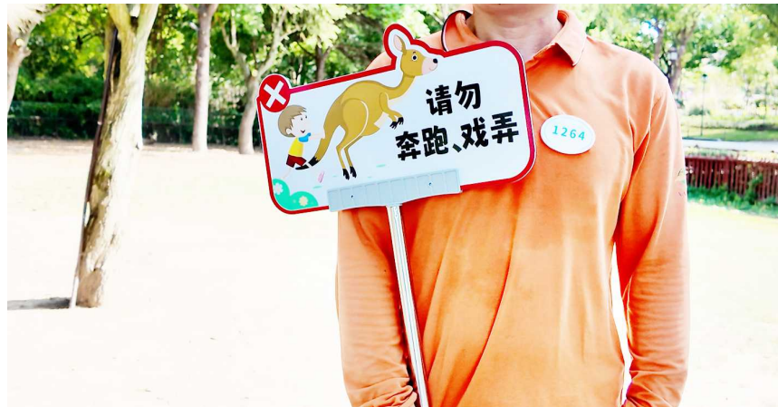
“袋鼠坡”增派工作人员并手举提示牌进行引导

一名“袋鼠坡”工作人员告诉记者,目前,巡视工作也进行了提升,如果游客做出一些不规范的动作,尽可能提前发现,主动进行规劝和引导。