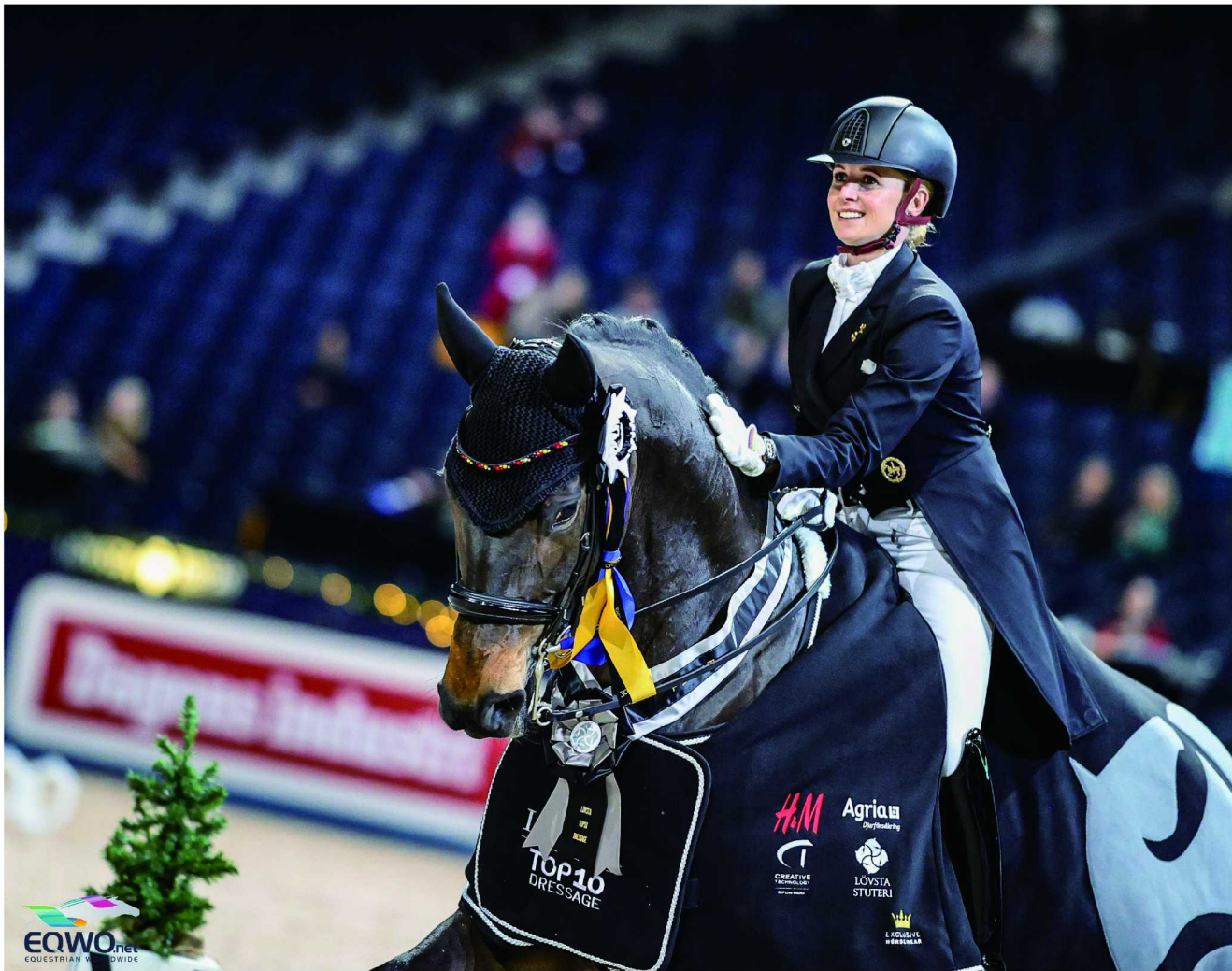
德国马术运动员Jessica Von Bredow-Weindl佩戴RM 07-01

“当我推出这个品牌时，人们总是告诉我，戴着一块陀飞轮手表打高尔夫是不可能的，而我证明了，事实恰恰相反。人们说戴着手表打马球是不可能的，因为马球杆会把手表砸坏……我推翻了这些说法。”Richard先生对于自己“初出江湖”就大获成功颇为得意。他最大的心愿之一就是戴着自己品牌的腕表去驾驶赛车，比赛过程中腕表可以抵挡加速过载、剧烈震