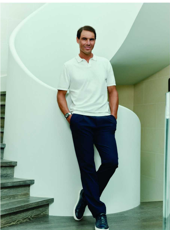
超过十年的RICHARD MILLE品牌挚友拉菲尔·纳达尔(Rafael Nadal)