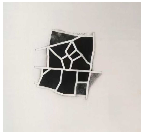
迈克尔·普拉纳斯 Topos 系列 宣纸水墨 2013年