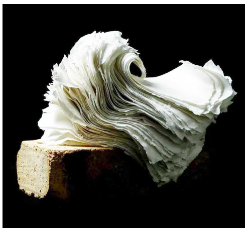
苏献忠《纸》陶瓷与砖 2019年