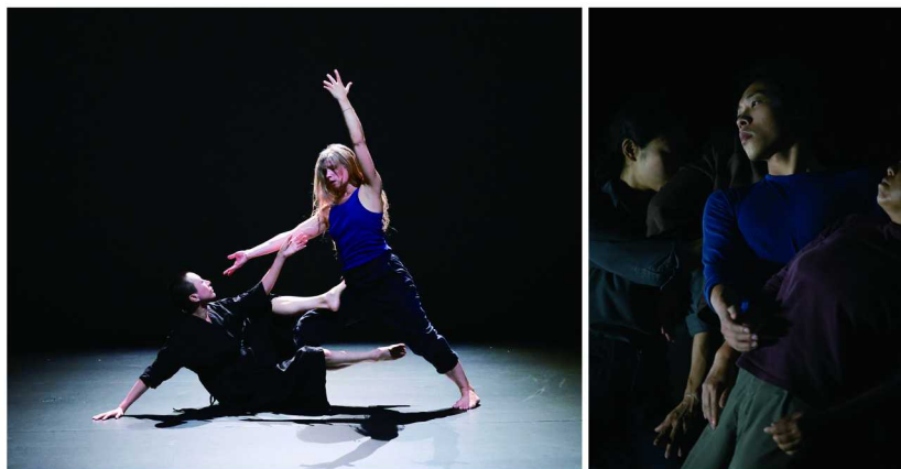
左：双舞作品《一石一鸟》右：《褶皱》纯简版-3

西岸滨江迎来的是一场关于舞蹈之美的探索。开云集团携手上海西岸美术馆联袂呈现第三届“跃动她影在西岸”当代舞蹈节，以“身体之重”为主题，结合影像、主题对话、工作坊以及即兴舞会等多种形式，借由舞蹈这一古老的语言探索女性、身体与空间，书写当代的美与自由。活动恰逢中法建交六十周年，也以此推动了两国文化艺术交流。