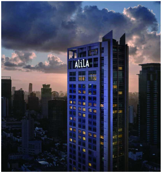
阿丽拉上海 - 酒店外观夜景

从酒店步出，同样可以探索上海的文化底蕴：既可以散步去张园，这里的石库门建筑群保留了上海独特的历史风貌；也可以去南京西路购物，感受上海的时尚与繁华。