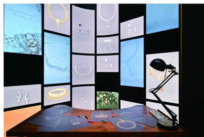
戴比尔斯珠宝 Forces of Nature 高级珠宝展