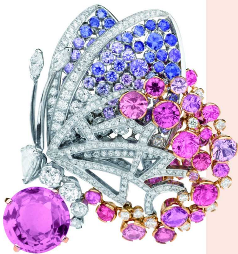
梵克雅宝 Papillons 蝴蝶高级珠宝系列 Apollon 胸针