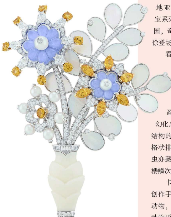
梵克雅宝 Bouquet de calcédoine 胸针

有蝴蝶，自然少不了花朵。Flowers 高级珠宝系列便是这样一个洋溢幸福气息的高级珠宝系列，展现了隽永蓬勃的生机。Van Cleef & Arpels 梵克雅宝以争奇斗艳的花卉为灵感，捕捉了恬静花园之美，色彩缤纷的宝石犹如艺术家手中的调色板，充满灵动生机。不同色彩与形状巧妙结合，彰显了每一朵花的独特魅力。