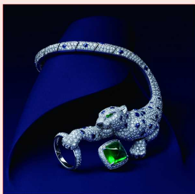
卡地亚 PANTHÈRE JAILLISSANTE 高级珠宝手镯

高级珠宝设计的灵感往往源自自然，细腻而真实。缤纷的彩色宝石，令每一件珠宝如同花朵绽放，展现出生命的勃勃生机；动物的形态则为珠宝设计增添了灵动，仿佛讲述着自然界的故事；山川河流的壮丽与宁静也通过高级珠宝得以栩栩如生地呈现，凝聚成永恒的艺术品。当自然与生活紧密相连，每一次的闪耀都散发出温暖与力量。