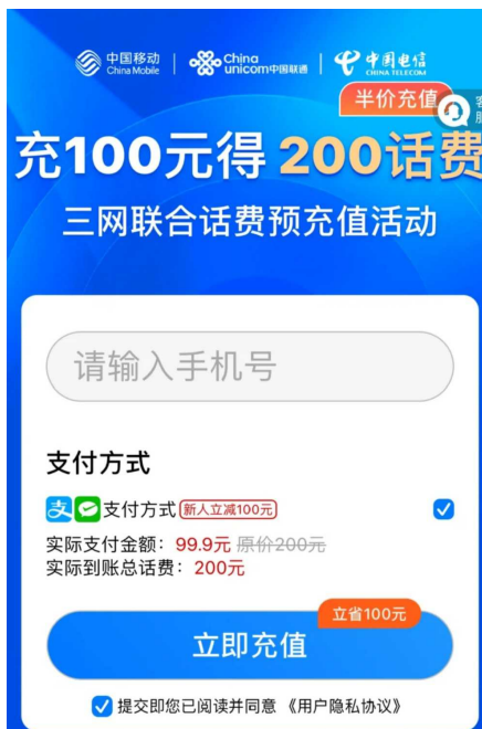
充值页面看起来很正规