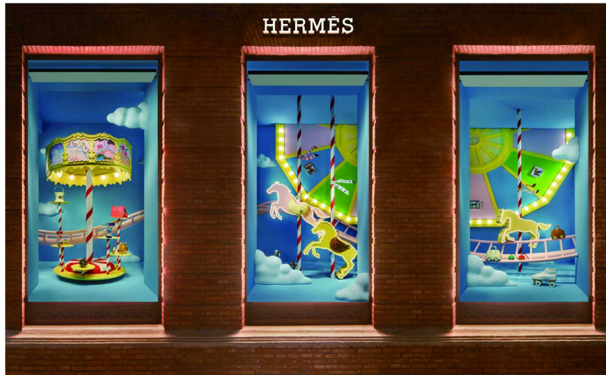
上海“爱马仕之家”2024年冬季橱窗《“骑”梦游园》-女性世界橱窗