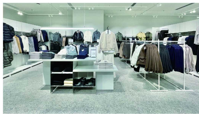
H&M 上海瑞虹天地太阳宫店以崭新形象为顾客提供焕然一新的时尚购物体验

落地橱窗和简洁时尚的陈列设计，提供了明亮通透而舒适便捷的购物空间。新店不仅展现了前沿的时尚灵感，更为顾客提供更多个性化穿搭建议，成为了一处汇集穿搭、创意和文化的时尚聚集点。与此同时，2024 节日系列新品也于店内亮相，呈现简洁利落的剪裁，并融入聚会概念的氛围巧思，经典黑白的主基调，融合亮片、蝴蝶结和精美刺绣，以复古元素演绎了简约风格与节日氛围的巧妙结合。