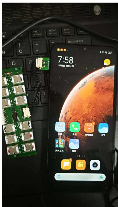
违法人员用多个账号抢订场馆

记者最新了解到,12月9日,上海市体育局印发《上海市公共体育场馆开放运营管理办法》(以下简称《办法》),其中特别提到:“公共体育场馆应当按照统一的数据标准接入政务服务‘一网通办’平台,为市民提供信息查询、预约等服务。”