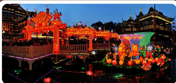
2010 ▲ 2010年，豫园灯会“请”来了世博会中国馆和海宝。 ▼ 首出国门，受邀参展首尔国际灯节，创下首尔灯节单体规模最大、总量最重灯组的纪录。