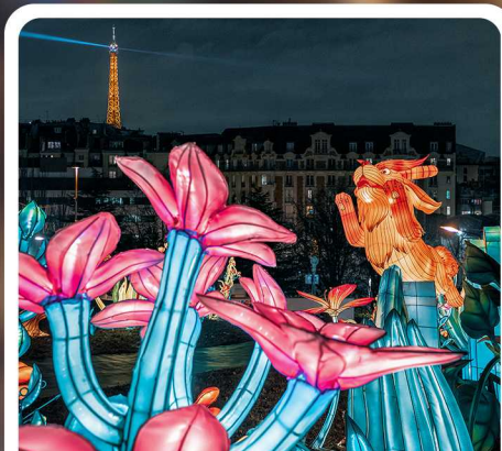
2024 首次跨国举办，巴黎与上海同日点亮华灯。