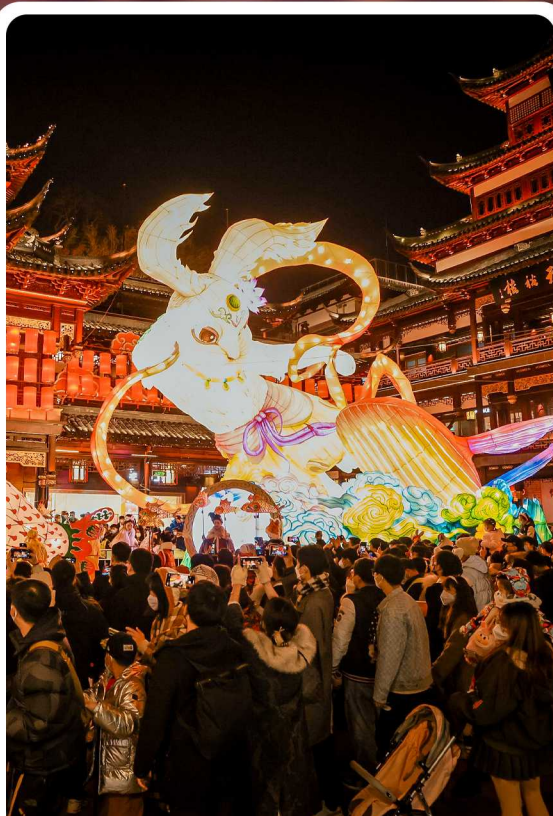
2023 以中国传统神话《山海经》为蓝本，豫园灯会开启“山海奇豫”。