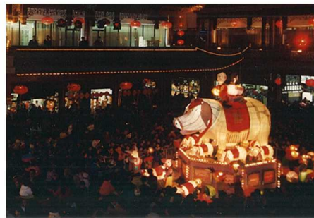
1995 豫园商城一期工程改扩建竣工后，开始重新举办元宵灯会。