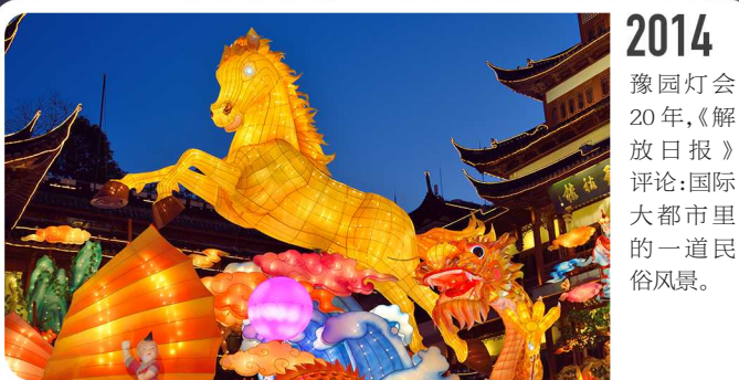
2014 豫园灯会20年，《解放日报》评论：国际大都市里的一道民俗风景。