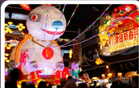
2011 豫园灯会被列入国家级非物质文化遗产名录（第三批）。