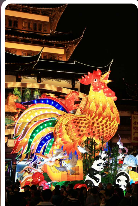
2017 弘扬中华优秀传统文化，经典故事精彩演绎，豫园灯会更上一层楼。