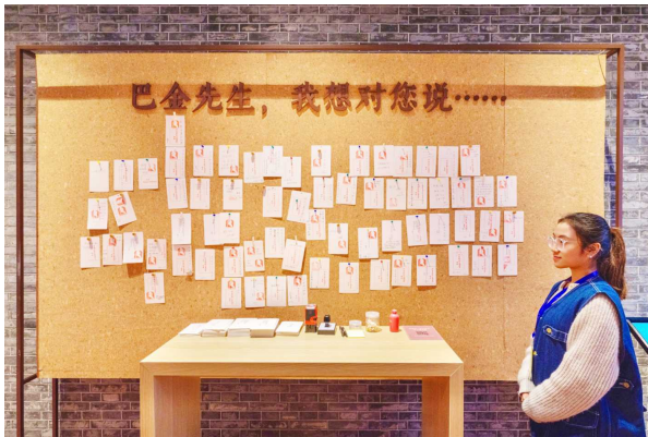
巴金图书馆主题纪念章和卡片

可能市民看到的是展览呈现出来的画面,还没有注意到其实我们这次展览里面还有很多的多媒体,多媒体是展览画面的延伸,我希望大家看展的时候,有时间去翻一翻我们制作的多媒体。而且多媒体是动态的,我们在后续会不断增添内容。这些多媒体梳理了巴金先生他们一代人的内容,已经超出我们展览能够展示出来的内容。