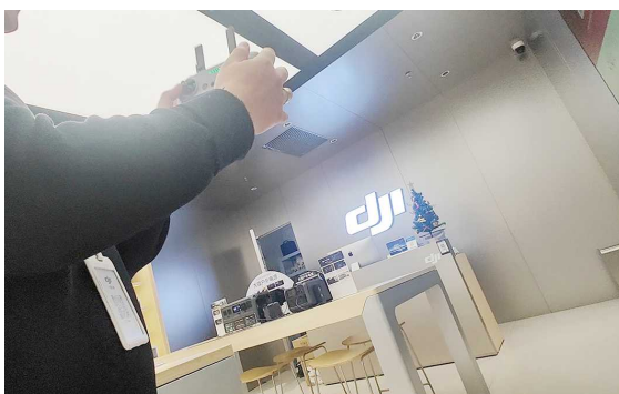
环球港大疆店员在店铺内试飞无人机

和上述“体验专区”不同,上海环球港授权体验店、上海太阳宫授权体验店则是传统的店铺,和商场公区的空间天然有所区分。记者实地体验时,这两个店铺的店员均在店内对 DJI AIR3S 进行试飞,并未飞到公共区域。此外,当记者提出体验跟随功能时,两家店的店员均谨慎地简单比划或仅让镜头方向跟随,并未真的放任无人机跟着记者大幅走动。