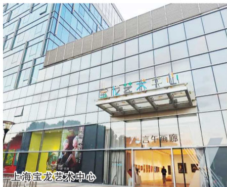
上海宝龙艺术中心