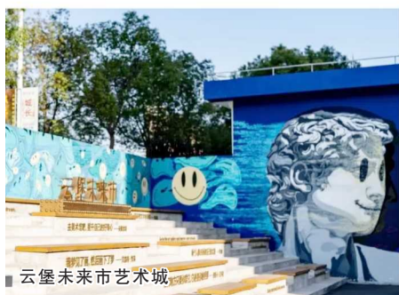
云堡未来市艺术城