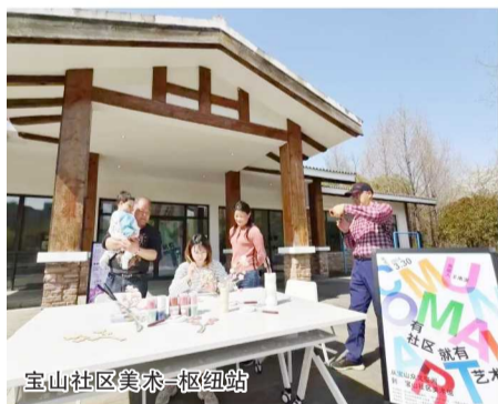
宝山社区美术-枢纽站