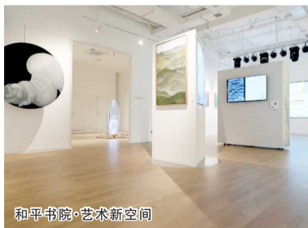
和平书院·艺术新空间