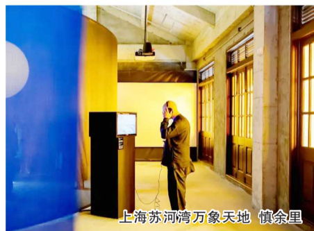
上海苏河湾万象天地 慎余里