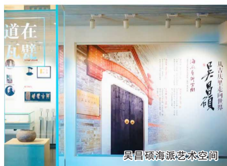
吴昌硕海派艺术空间