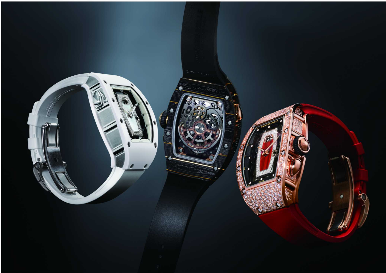
RM 037自动上链腕表系列

RM 037系列在材质上也展现了品牌的不懈创新精神，提供五级钛合金款、红金款、Gold Carbon® TPT碳纤维款、宝石镶嵌款、白色陶瓷款、Carbon TPT®碳纤维