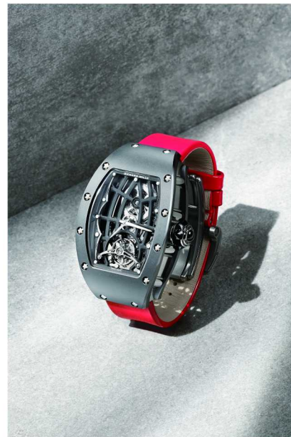
RM 74-01自动上链女士陀飞轮腕表

RM 74-01搭载品牌自主研发的CRMT6机芯，其底板和桥板均采用经过PVD与电