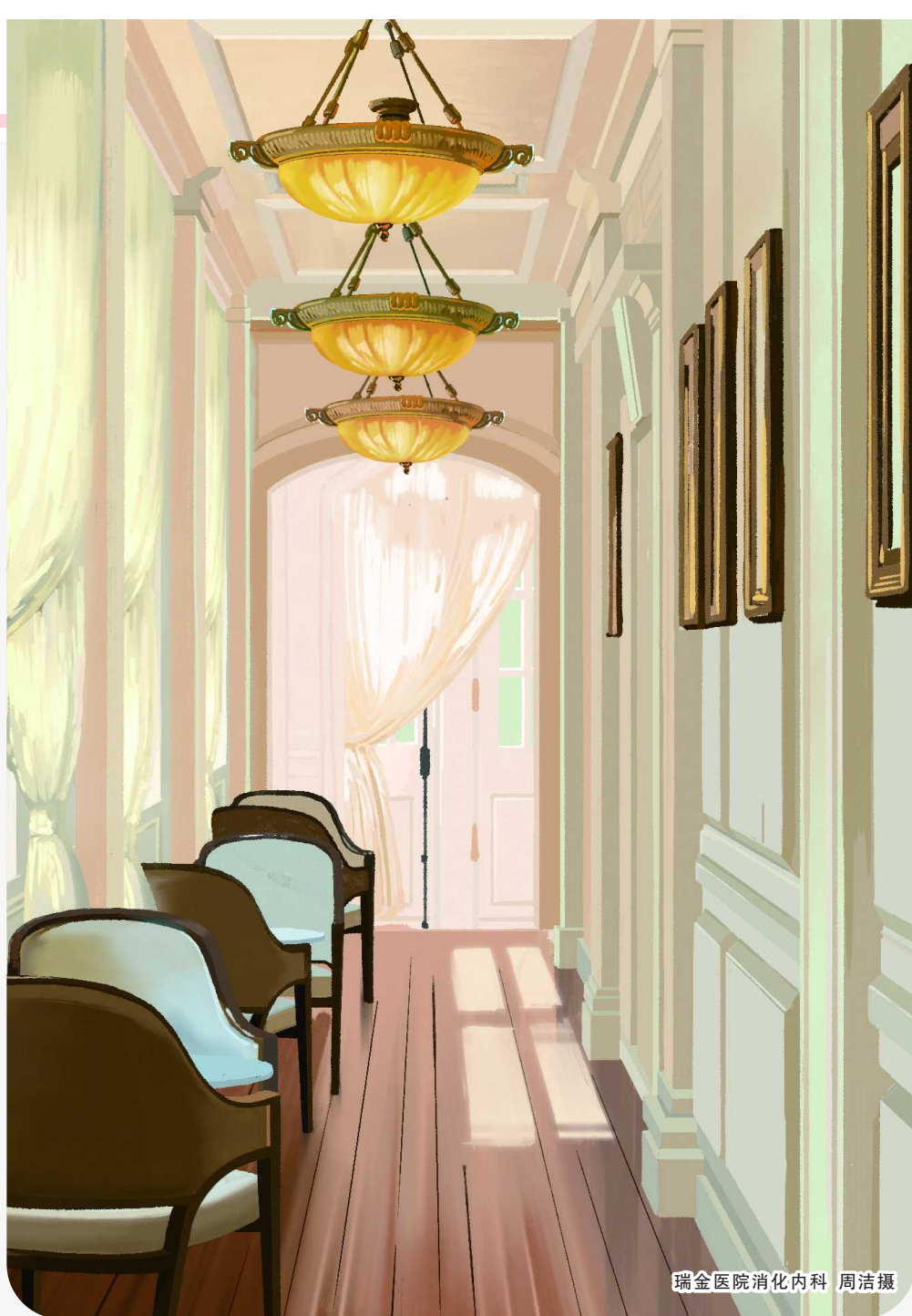
瑞金医院消化内科 周洁摄

物换星移,从新生命的降临之地,到今天的行政楼,8号楼默默见证了许多人生故事,有笑,有泪,有收获,更是爱与包容。