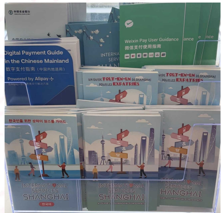
服务中心上摆放的各类服务手册