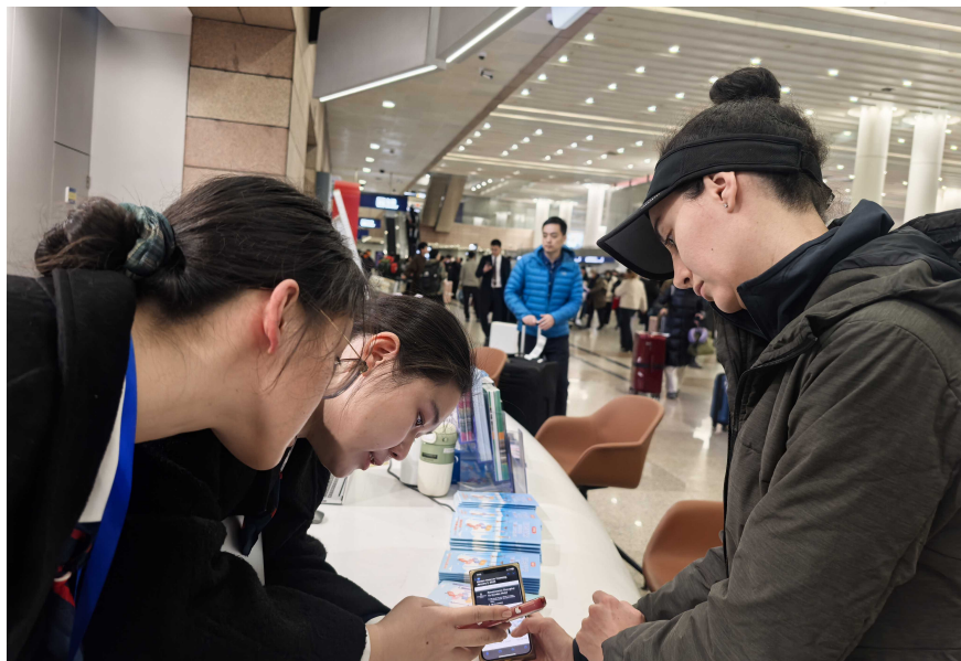
外籍人员一站式综合服务中心浦东T1航站楼站点

按照市委、市政府的总体决策部署，市政府外办联合人民银行上海总部、市交通委、市文化旅游局、市通信管理局，及机场集团、东浩兰生集团，在浦东机场T1和T2航站楼、虹桥机场T1航站楼共同打造三个外籍人员一站式综合服务中心，提供支付、交通、文旅、通讯等四类服务。自去年9月27日全面启用至今，三个服务中心已接待外籍人员业务咨询办理近20万人次，获得多国旅客口头及书面表扬超3.4万次，承载了外籍人员对这个“上海初遇”第一站最真挚的感谢与赞美。