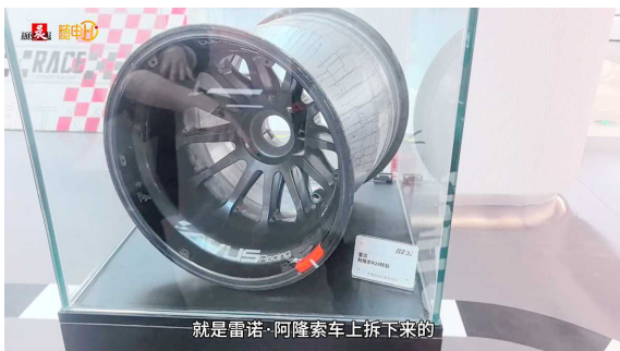
就是雷诺·阿隆索车上拆下来的