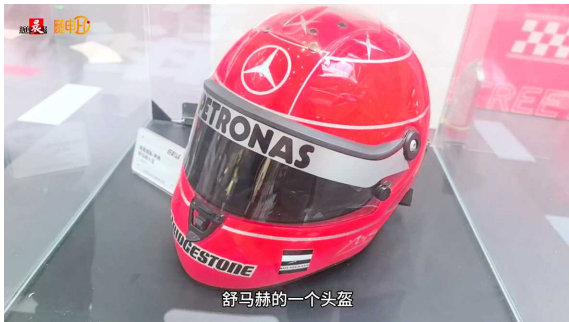
舒马赫的一个头盔

3月，F1 中国大奖赛如约而至，全城热度又将被点燃。2月28日，车迷们拿出珍贵的收藏品、F1 周边店提前开售最新款……F1 快闪活动来到南京西路！能看到舒马赫的头盔、周冠宇的签名鞋、全球仅7辆的高奢赛车模型，F1 票根冰箱贴，还能模拟上道开赛车！