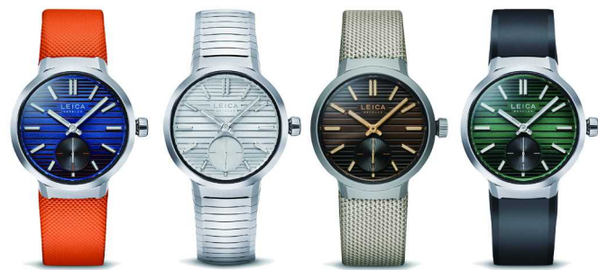
关键词：持续突破 徕卡 ZM 12 腕表系列

150 多年来，徕卡始终以创新精神、非凡工程和永恒设计闻名于世。全新 ZM 12 腕表系列延续品牌传统，以纯粹外表诠释极简美学，以精巧尺寸与卓越性能，开启与徕卡爱好者的全新对话。