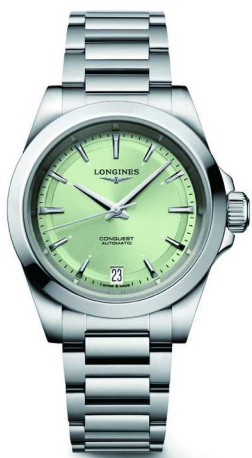
关键词：多维魅力 浪琴表 康卡斯系列悦动腕表

在瞬息万变的时代，腕表设计正突破传统边界，重新定义时间的美学与功能。它们以精巧的设计承载历史的厚重，以精准的机芯诠释科技的进步，以独特的风格呼应佩戴者的个性。时间不再被束缚，视野不再被局限。每一枚腕表，都是一次对未知的探索，一次对自我的表达，一次对未来的想象。