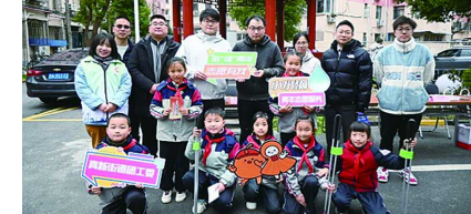
察觉到这一问题，联合学校绿光社团开启了宣传视频的制作之旅，他们用有趣童真的视角，构思了一系列别出心裁的内容，吸引了居民们和家人们的广泛关注。

“一盔一带”关乎生命安全，然而在日常生活中，部分居民对此重视程度远远不足，骑车不戴头盔、乘车不系安全带的现象屡见不鲜。队员们敏锐地