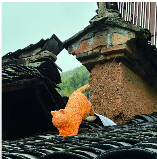
左：驻地艺术家傅冠丰《跳出美术馆的猫》/3D打印竹篾条 共创者：村民叶法文 右：从织美术馆内向外眺望