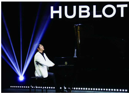
HUBLOT 宇舶表品牌大使朗朗现场演奏