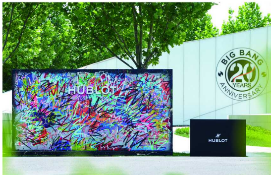
HUBLOT 宇舶表街头艺术涂鸦墙

国际钢琴大师朗朗的两度登台成为当晚最大的惊喜之一。他先以一曲《升F小调波罗乃兹》揭幕体验空间，再即兴返场以《火焰舞》点燃全场。琴音与机芯的韵律交汇共鸣，在指尖演绎出时间的跳跃节奏。