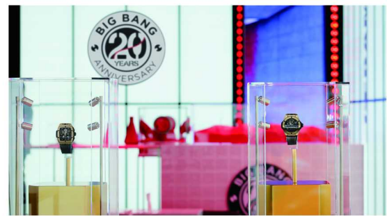
HUBLOT 宇舶表 BIG BANG 之夜互动体验空间