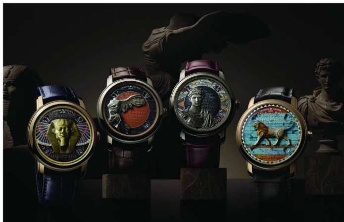
(左) Métiers d'Art 艺术大师系列“致敬伟大文明”腕表

七个区域，一段臻途。江诗丹顿用一处空间，让270年历史转化为可触、可感的现实时空。它既是品牌精神的一次具体化，也是一场关于时间、文化与技艺的深度共鸣。江诗丹顿的臻途，仍在延续。