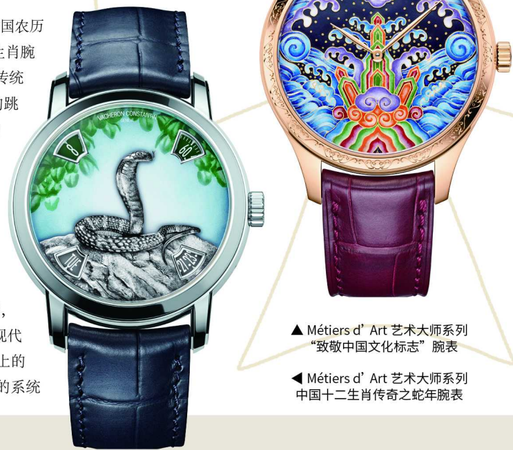
▲ Métiers d'Art 艺术大师系列“致敬中国文化标志”腕表

在张园呈现的“臻途”限时体验空间，不只是一次展览，更是一种姿态——品牌在此回应历史，也在此发声未来。正如张园所象征的，是上海作为东西文明交汇口岸的缩影，这场展览的落点，亦是江诗丹顿270年“时间之路”在中国的一次深情回响。