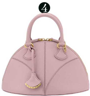
04 勾勒心跳曲线 BVLGARI Divas' Dream Marquise 七夕甄选手提包

它适合周末出游或七夕的街拍造型，搭配宽松衬衫或飘逸连衣裙都毫不违和，轻松为整体增添一抹随性又有格调的轻奢感。