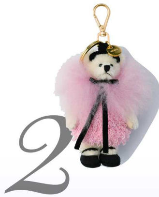
02 给包包的甜蜜配饰 PRADA PRADA Teddy 手袋饰件

一次次遇见。COCO 手链将米色18K金、黄K金或白K金打造，可镶嵌红宝石，简洁与华美在一条手链上达成平衡。你仅佩戴一款手镯，也可随心叠加、自由混搭。在七夕这样的日子里，它将替你告白：“你是我生命里一次又一次想要遇见的人。”