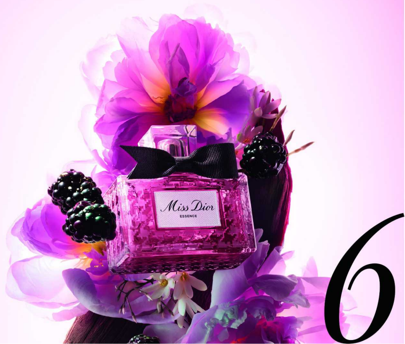
06 直抵本真的温柔香气 DIOR 迪奥小姐馥郁香精

Le City 是包包界的经典百搭小能手，这款粉色 Storico 细纹羊皮革版本更是少女心满满。细腻的皮革纹理在阳光下泛着柔和光泽，黄铜金属配件低调中透着质感。包袋有多种背法，斜挎、肩背、手提，足以满足不同场合的搭配需求。内外空间合理，日常必需品可轻松收纳。