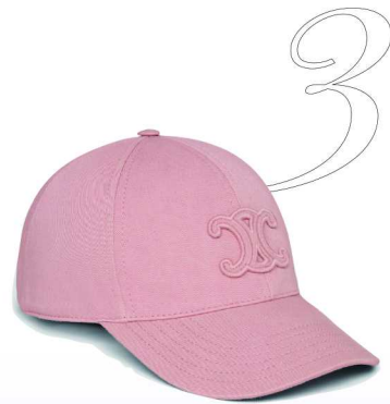
03 随性的时髦态度 CELINE Celine TRIOMPHE 棒球帽

这款白色与兰花粉双色调的 Teddy 手袋饰件，活泼又不失优雅。金属环与挂钩设计灵活，轻松挂在各种手袋上，为整体造型添趣味与个性。涂珐琅三角形金属徽标低调显贵，既呼应品牌 DNA，也为饰件增添设计感。想象一下，约会时，你的包包摇曳着这只可爱的 Teddy，传递出俏皮又时髦的气场。小物虽小，却能让你的造型瞬间活力满满，俏皮甜美。