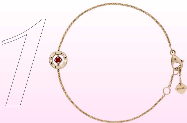
01 每一次遇见都算数 CHANEL