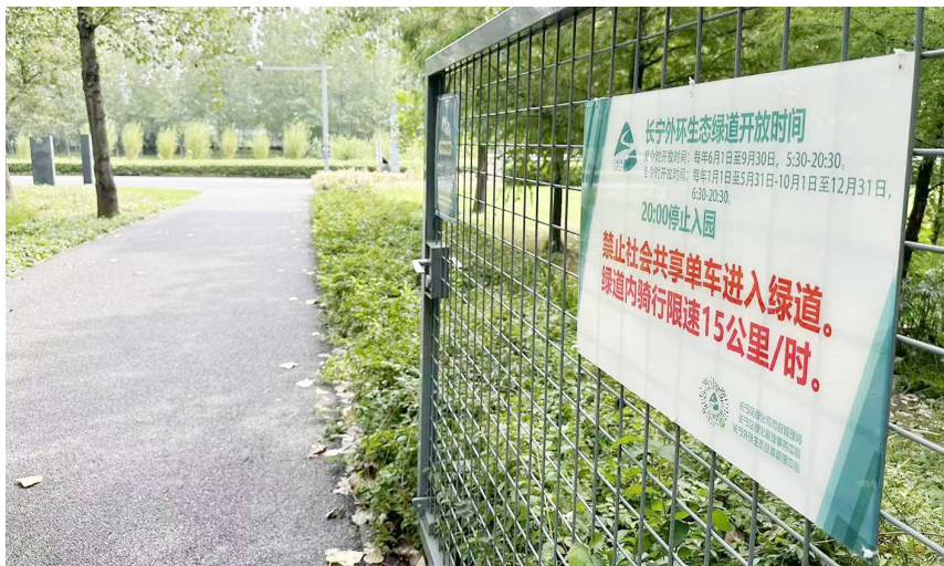
长宁生态绿道(虹桥体育公园入口)禁止共享单车进入标识