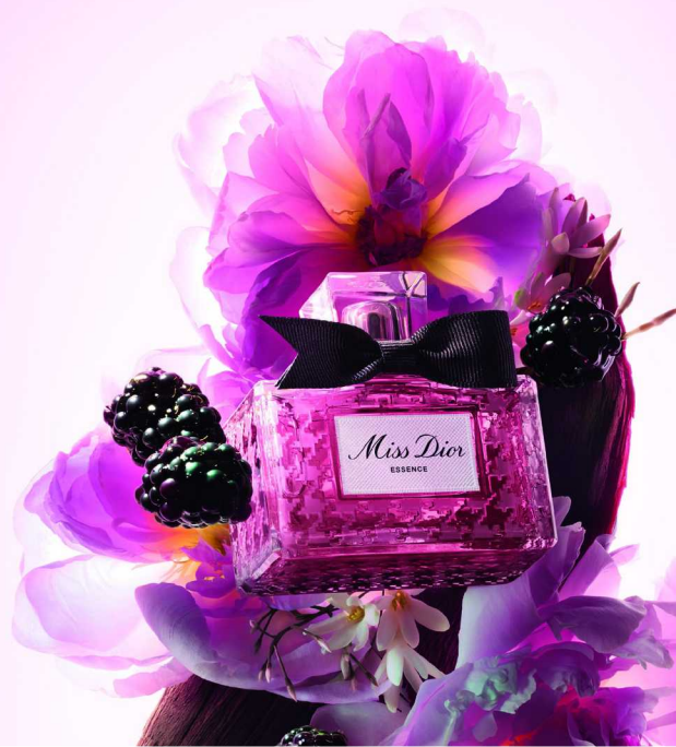
06 直抵本真的温柔香气 DIOR 迪奥小姐馥郁香精

Le City 是包包界的经典百搭小能手，这款粉色 Storico 细纹羊皮革版本更是少女心满满。细腻的皮革纹理在阳光下泛着柔和光泽，黄铜金属配件低调中透着质感。包袋有多种背法，斜挎、肩背、手提，足以满足不同场合的搭配需求。内外空间合理，日常必需品可轻松收纳。