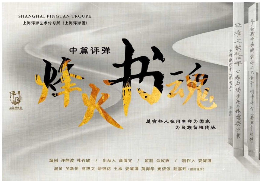
中篇评弹《烽火书魂》演出海报