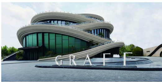
格拉夫《臻启新章：65周年展览》

展览开幕式上还吸引了杨紫琼、孙俪、马龙、王力宏、刘昊然等嘉宾出席，现场光影交错，钻石璀璨，令人于光影中，感受珠宝的无限魅力。