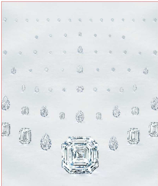
The Graff Lesedi La Rona, 重 302.37 克拉