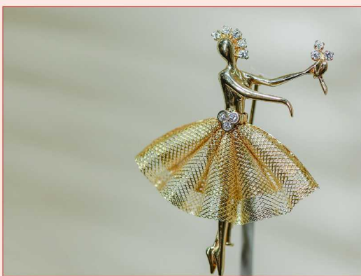
梵克雅宝 Sequin Dancer 胸针，1946年