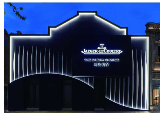
积家“时光铸梦”限时主题空间

开幕夜特别呈现动画导演Jackie Wang创作的《时光奇境》(Drawn in Time)，通过早期费纳奇镜技术手绘动画重现电影艺术起源，为展览增添现代艺术感。积家全球代言人章子怡、易烊千玺、金宇彬，以及品牌挚友汪顺和嘉宾陈慧琳、侯佩岑、李沁、黄湘丽等则出席开幕仪式，共同感受文化更迭与风尚涌动，见证了计时艺术的未来之梦。