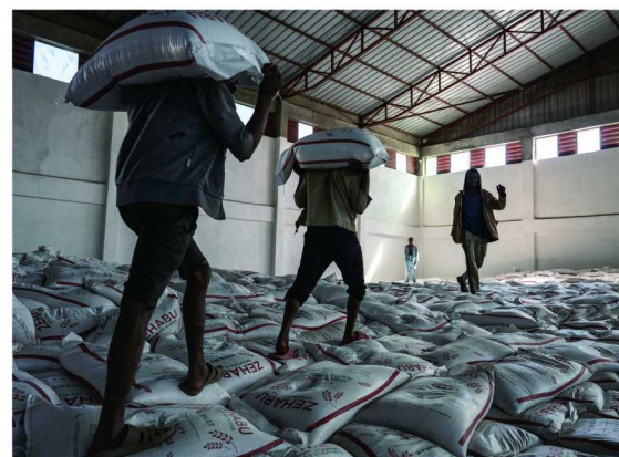
在埃塞俄比亚布拉尤的亚的斯面粉厂，工人们正协助卸载小麦。