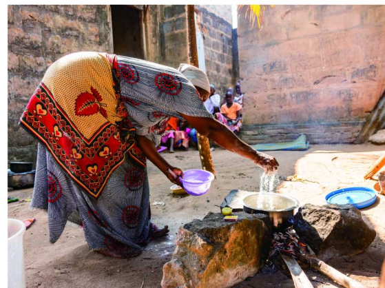
一名妇女在坦桑尼亚维金杜村为一群孩子端上装满玛加利的餐盘，这种食物是用强化面粉制成。