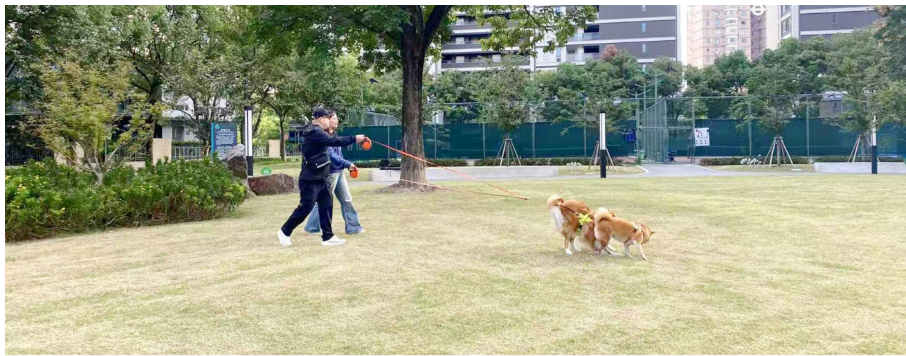
市民在古北市民公园遛狗

尽管如此,考虑到部分市民需求,长宁区绿化管理部门日前决定,在长宁西部再增加一座宠物友好试点公园,黄浦区也决定新增南园滨江绿地为宠物友好试点,收集更多宠物友好试点经验。