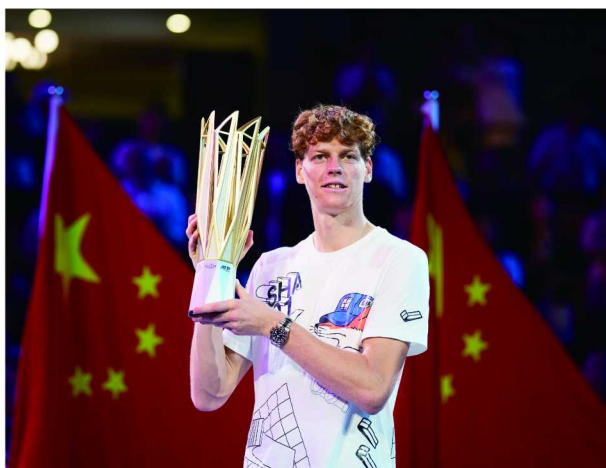
劳力士代言人詹尼克·辛纳手捧2024年上海劳力士大师赛冠军奖杯