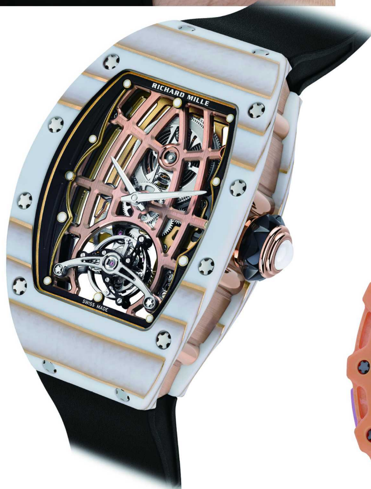
RM 74-02自动上链陀飞轮表Gold Quartz TPT®金石英纤维

总之，RICHARD MILLE理查米尔以色彩为切入点，将出色的技术引向了艺术的领域。这让品牌有了更鲜活生动的生命力，面对着未知的未来，有了更多从容与自信。艺术引领加上技术的底层加持，一体两面，塑造出RICHARD MILLE理查米尔在制表业内的独特定位与无可限量的发展潜力。