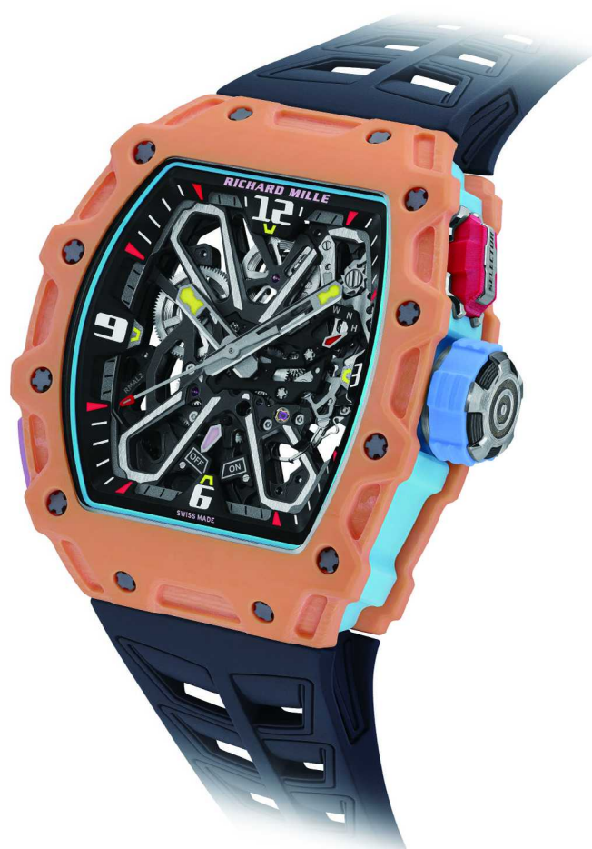
RM 35-03的淡蓝色石英纤维表壳