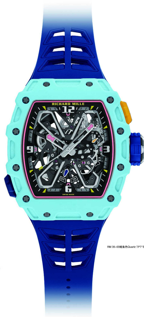
RM 35-03鲑鱼色Quartz TPT®石英纤维表款