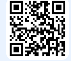
扫码查看完整进博消费地图

手持“参展证”,跟着进博美食地图和进博消费地图,展商与观众不仅能在虹桥商务区一站式尝遍全球风味、尽享购物乐趣,还能在多元场景中感受上海开放包容的城市脉动,实现“参展+体验”双丰收,玩出与众不同的进博新花样。