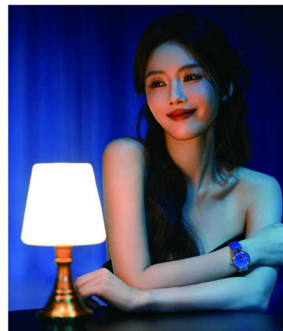
演员蔡文静演绎全新心月系列星辰腕表