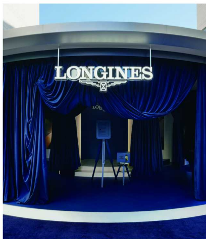
浪琴表心月系列星辰腕表快闪空间