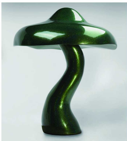
上：西尔维·弗勒里，《蘑菇 U Gweiss A110 绿-红中号 1003-M》，2008 年 下：罗伯特·费里欧，《等效原则：做得好，做不好，没有做》，1968 年