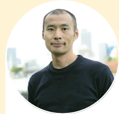
吉竹伸介 日本绘本作家