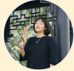
阿梗|中国美协动漫艺委会委员,北京印刷学院教授

阮筠庭自1998年开启漫画创作,出版《绘羽》《画夜》《月亮短歌》等作品,风格兼具诗意与想象力。她执导的独立动画电影《白蛇/White Snake》入围法国安纳西、德国斯图加特等国际动画电影节,还客座于法国斯特拉斯堡高等装饰艺术学院(法国莱茵高等艺术学院),新作漫画《春晖》入选新京报2025年度全国十二本评委和编辑部推荐好书。