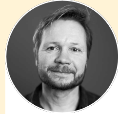
厄伊温·图谢特尔 挪威作家、插画家