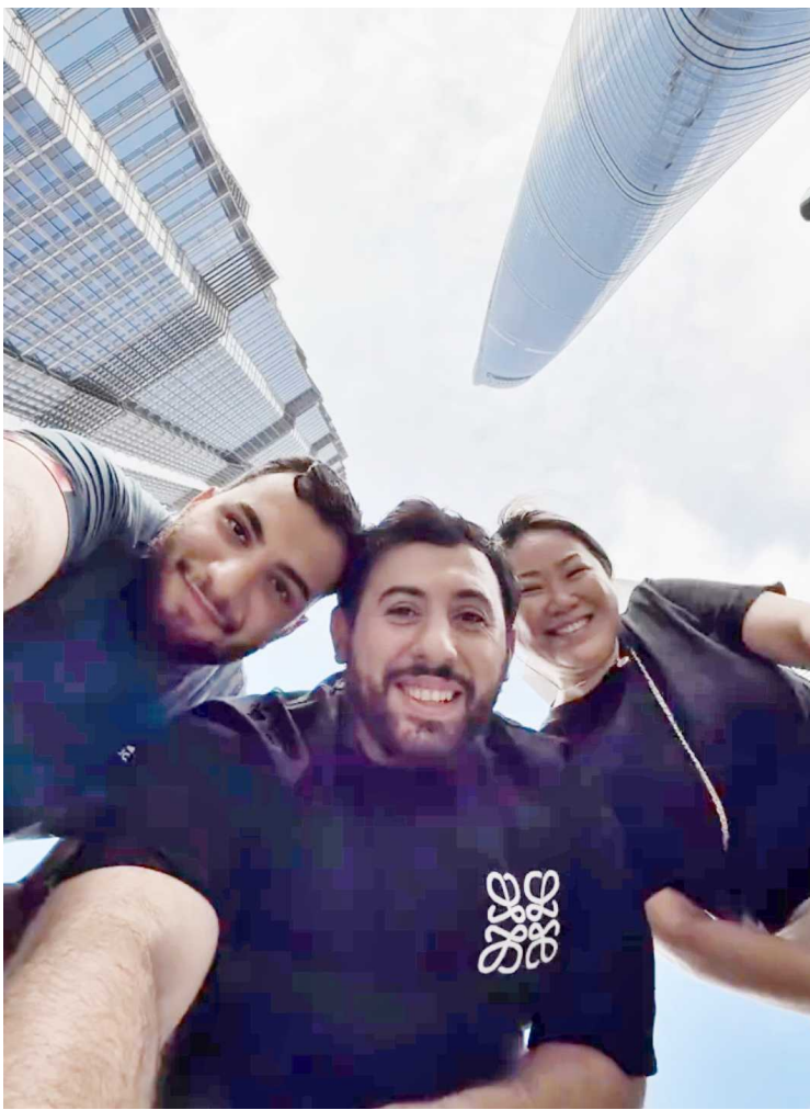
晨报记者 沈坤或 丁梦婕