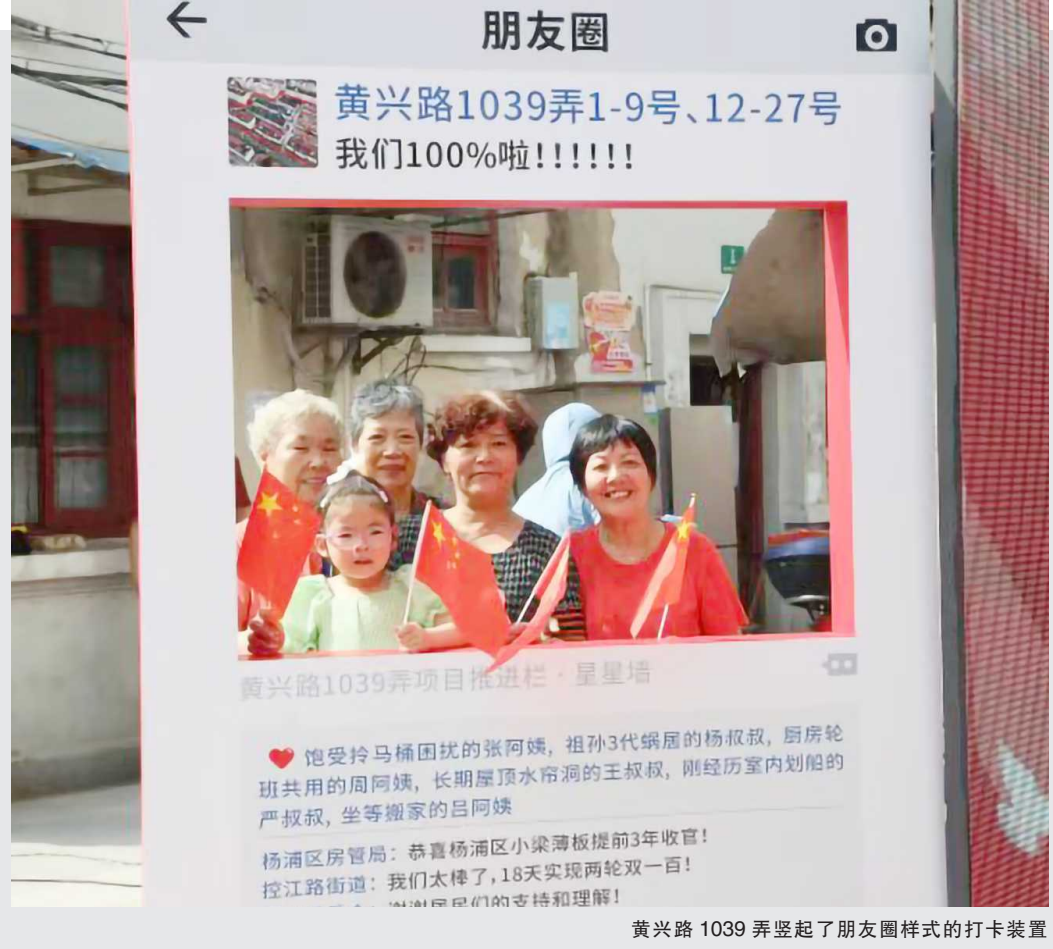
黄兴路1039弄竖起了朋友圈样式的打卡装置