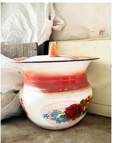
田阿婆家之前用的痰盂