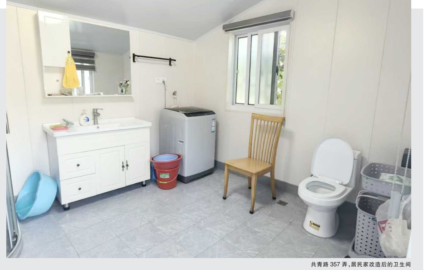
共青路357弄,居民家改造后的卫生间