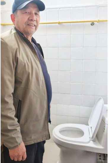
王老伯家新装的抽水马桶

这段历程,对于杨浦,不仅是物理空间的更新,更擦去了“穷街”的旧标签,写下了“秀带”的新注脚。马桶虽小,民生事大,消失的手拎马桶,丈量着城市治理的精度,更标志着人民城市的幸福温度。