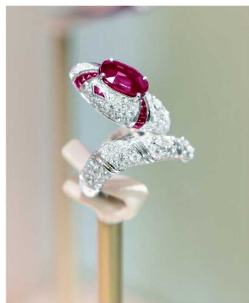
宝格丽灵蛇力蕴 (Serpenti Forces of Beauty) 高级珠宝戒指