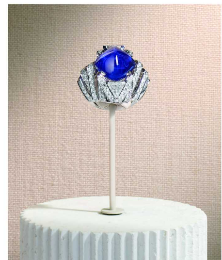
全新卡地亚 EN ÉQUILIBRE 高级珠宝系列 FLEXURA 戒指

高级珠宝不仅是珍稀材质的堆砌，更是对形、色、光与空间的深度探索。当光影与宝石相遇，当匠心与创意共舞，2025年的高级珠宝世界呈现出全新的视角。自东方古典园林的静谧曲线，到西方现代艺术空间的几何律动；从色彩斑斓的海洋奇想，到建筑美学的比例与秩序——珠宝不仅折射光芒，更雕刻节奏与空间，在静默中蕴藏时间、形式与光的诗意。