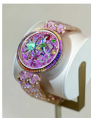
宝格丽花园绮境 (Il Giardino Diva) 高级珠宝腕表