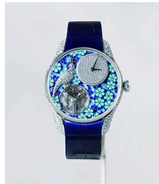
蒂芙尼让·史隆伯杰高级珠宝系列鸟栖花境飞行陀陀腕表

在深蓝色调与波纹图案交织的空间中，2025 Blue Book 高级珠宝系列 Sea of Wonder 瑰海奇珍带来一场穿越海洋秘境的奇幻之旅：花舞海葵 (Anemone) 主题的灵感源自让·史隆伯杰一系列妙趣横生的海葵胸针设计，洋溢着灵动韵律与奇思妙想，其中一款项链更是在三颗未经优化处理红宝石的点缀下，尤为瞩目；瀚海星螺 (Shell) 主题以铂金、黄金勾勒蜿蜒起伏的曲线，钻石与黄钻镶嵌其间，再现贝壳自然“隆起”的形态，充满肌理之美；海灵仙女 (Mermaid) 主题则探索美人鱼的韵