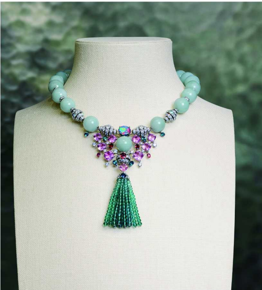
全新卡地亚 EN ÉQUILIBRE 高级珠宝系列 DIVITA 项链