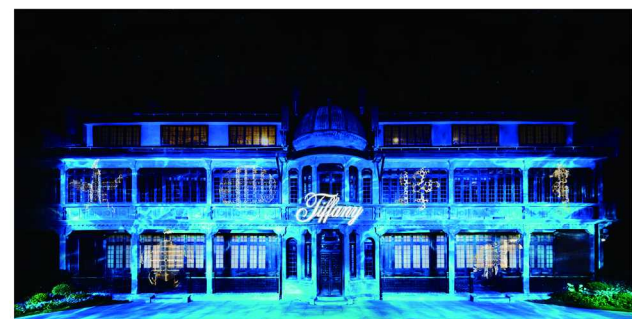
蒂芙尼于上海张园呈现 2025 Blue Book 高级珠宝系列 Sea of Wonder 瑰海奇珍秋季作品

宝格丽品牌代言人吴磊胸前佩戴宝格丽 Serpenti 高级珠宝系列胸针，一颗圆形帕拉伊巴碧玺以明亮的蓝色调嵌于蛇首中央，两颗弧形切割祖母绿点亮蛇眸，璀璨钻石沿曲线勾勒灵蛇曼妙身姿，为每片鳞甲赋予璀璨光泽。腕间 Octo Finissimo 大理石陀陀腕表以绿色大理石表盘与叠戴在指间的 Le Magnifique 高级珠宝系列祖母绿戒指及 B.zero1 系列戒指遥相呼应。