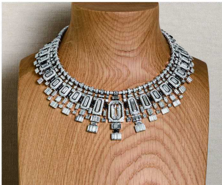
全新卡地亚 EN ÉQUILIBRE 高级珠宝系列 VETRATA 项链

作为卡地亚的隽永标志，猎豹于 PANTHÈRES REFLEXIO 项链上得以细腻展现。这款项链中央镶嵌一对丰盈华美的宝石：一颗 74.10 克拉绿色碧玺和一颗 14.91 克拉水滴形珊瑚，演绎卡地亚一个多世纪以来的标志性红、绿配色。得益于细致入微的串珠工艺，两侧簇拥的蓝绿色碧玺，将自然美感与对称结构和谐交融。两只猎豹以镜像方式相对而立，蓄势跳跃，生动逼真：从矫健的四肢、摄人心魄的祖母绿豹眼，到缀以黑色豹斑的皮毛与缟玛瑙豹爪，每处特征皆栩栩如生。