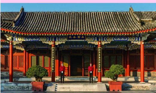
卡地亚全新 EN ÉQUILIBRE 高级珠宝展

全新 EN ÉQUILIBRE 高级珠宝系列以纯粹线条、立体造型、色彩平衡及虚实之间的尺度，演绎恰到好处的和谐美感。走入庭院深处，“色彩交融”“几何韵律”“光影构型”三个篇章次第展开，展现了卡地亚的鲜明风格与丰沛创意。