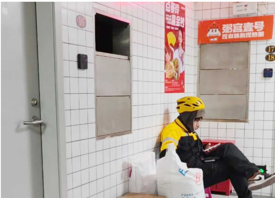
位于宝誉美食广场内的曼玲粥店

和其他堂食店相似,曼玲粥店水城路店是一家明亮干净的沿街小店。小店面积不大,内部由一道上窗下墙的隔断分隔成了厨房和堂食区两个部分。外卖店常见的外卖架,被放置在厨房区,保持了堂食区的干净整洁。