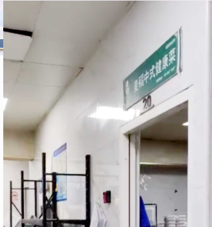
麦稻中式健康菜中环百联店

坐在小店里,可以明显感觉到,这家店的主要生意来源于线上。高峰时刻,店内此起彼伏的外卖声和后厨交谈声相当嘈杂,奔波于各个灶台之间的店员,对堂食客人的照顾能力和照顾意愿有限。即使是用餐高峰,除了特意找过来的记者,店内并没有其他堂食客人。尽管在硬件上已经非常接近,但从服务而言,这家店与普通堂食店之间仍有明显差距。