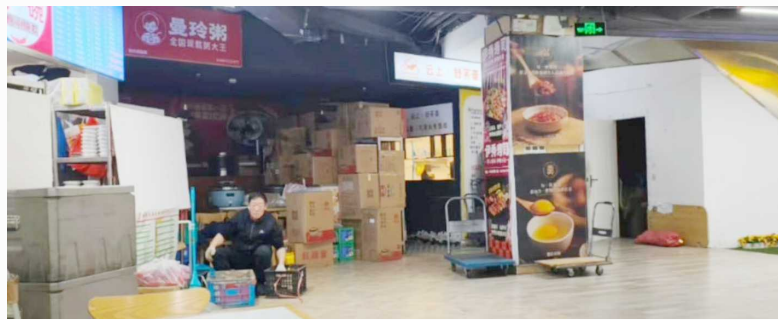
曼玲粥店门店区域并未开灯

只需要摆出来一两张桌子,就符合堂食店标准了?有消费者发现,外卖“无堂食”标识新规实施在即,一些有桌椅无服务、有地址无客流、有堂食标签却无服务意愿的“糊弄式”堂食店,开始冒头。这些混迹在外卖平台中的“糊弄式”堂食店,正成为消费者“明明白白消费”的绊脚石。 一直以来,加强对食品安全和消费者知情权的保护,始终是线上餐饮消费服务提升的重要环节。今年6月1日即将正式实施的《网络餐饮服务经营者落实食品安全主体责任监督管理规定》(以下简称《规定》)中特别明确,专门从事外卖服务、不提供堂食的外卖商家必须在其主页面显著位置设置“无堂食”标识,且外卖平台需将该标识同步展示在商家列表页面。 记者注意到,自去年新规征询意见稿发布以来,尽管各外卖平台尚未推出“无堂食”标识,但已通过设置“堂食店”标签或“可堂食”分类,将有堂食的外卖商家和纯外卖商家进行了区分。青睐购买堂食店外卖的消费者,可以通过识别“堂食店”标签的方式,挑选服务。 然而,一些消费者发现,个别商家为了骗取消费者对堂食店的信任,开出了“糊弄式”堂食店。这些“糊弄式”堂食店,大多缺少真实的堂食客流和堂食服务意愿,只是摆出了桌椅板凳做做样子。有些店铺,甚至连餐具、菜单、收款码等基本服务硬件都不全。 3·15之际,根据消费者提供的线索,新闻晨报·申度新闻记者对曼玲粥和麦稻中式健康菜两个知名连锁餐饮品牌共计6家标注有“堂食餐厅”标签的餐饮店进行了暗访调查。记者发现无真实客流、无服务意愿、服务设施缺斤短两的“糊弄式”堂食店,还真不少。